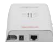
Nätverksuttag i medieomvandlare

Obs! Kontrollera att medieomvandlaren är ansluten till ett eluttag.